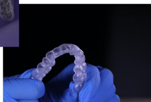
Chrániče zubů, dlahy a formy na bělení