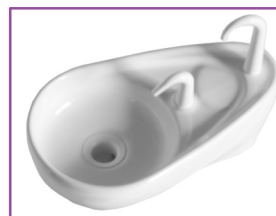
2 varianty plivátek