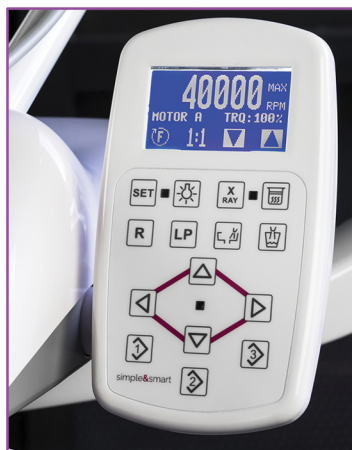
TKD DUOPAD (horní vedení)