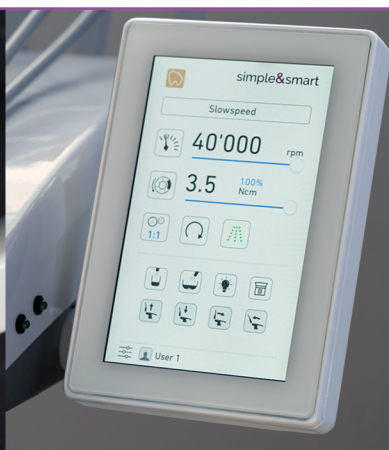
TOUCH BIENAIR (horní vedení)