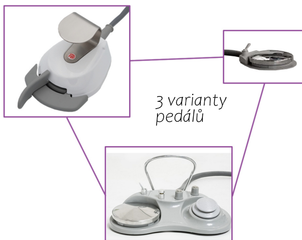
3 varianty pedálů